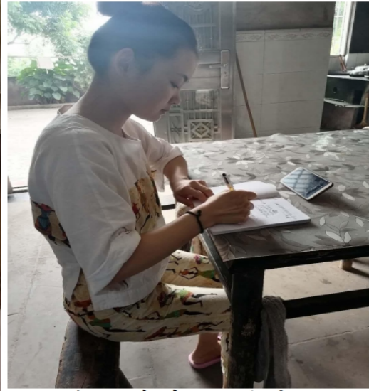
泸州龙马潭区参训教师