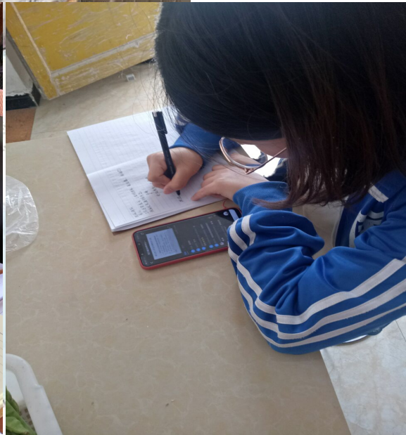
凉山州参加学习老师